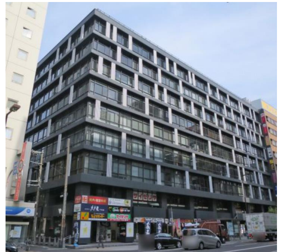
《 Sankyo Umeda Bldg 》

Midosuji Exit on the 1st floor of Osaka Station (JR Line), 7-minute walk from the south ticket gate of Umeda Station (Midosuji Line), 7-minute walk from the northeast ticket gate or northwest ticket gate of Higashi Umeda Station (Tanimachi Line), 7-minute walk from the exit “M-10” of Whity Umeda Izumi-no Hiroba.